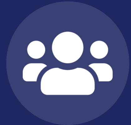
Subjek dan Objek Penelitian

Catatan: pada library research, tidak ada subjek manusia; sebagai gantinya cukup dijelaskan objek kajian (misalnya ayat-ayat tertentu atau kitab tafsir tertentu) pada bagian sumber data.