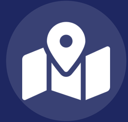
Tempat dan Waktu Penelitian

Catatan: bagian ini tidak berlaku untuk penelitian library research, karena tidak ada "lokasi" fisik yang diteliti — cukup dijelaskan dalam poin A bahwa penelitian bersifat kepustakaan, dan bagian B–C pada kerangka BAB III cukup dilewati/diganti dengan penjelasan sumber data (lihat bagian D).